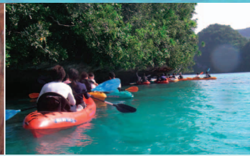
▲カヌーでパラオの美しい大自然を観察