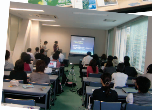
プレゼンテーションの様子▶