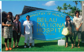
▲パラオの医療事情の取材をする学生