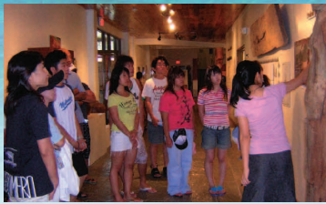
▲同立博物館にてパラオの歴史・文化のレクチャーを受ける

実習期間 2010年8月30日(月)～9月3日(金) 岡山県内の大学生なら、誰でも履修可能です。