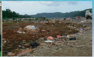
▲パラオの環境問題を目の当たりにする